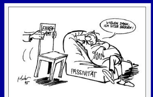
Zeichnung: Burkhard Mohr

Deshalb suchen wir Dich, egal ob politisch, für unseren Festausschuß oder als Austräger. Melde dich !